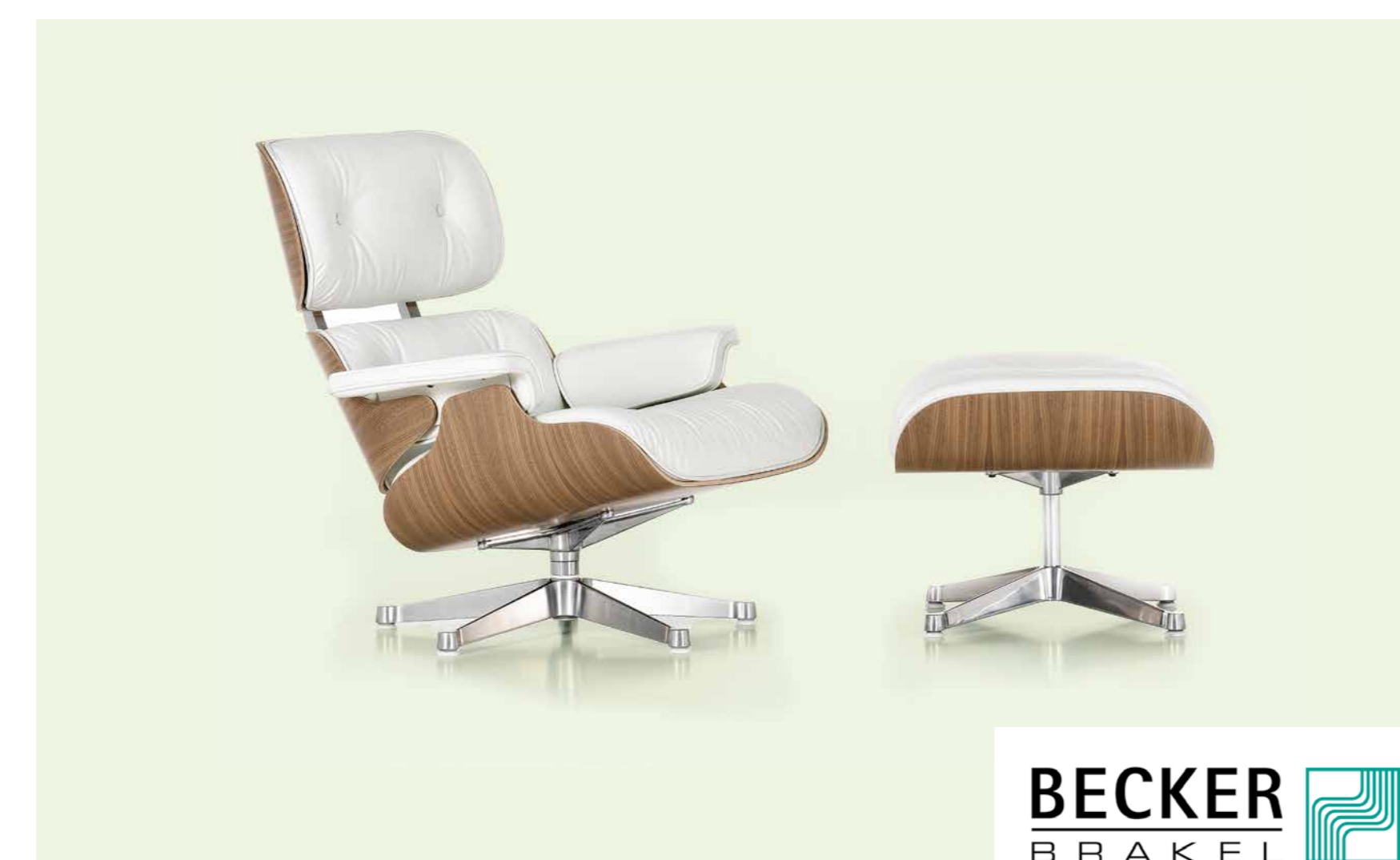
Produktionslinie für Formholzmöbel