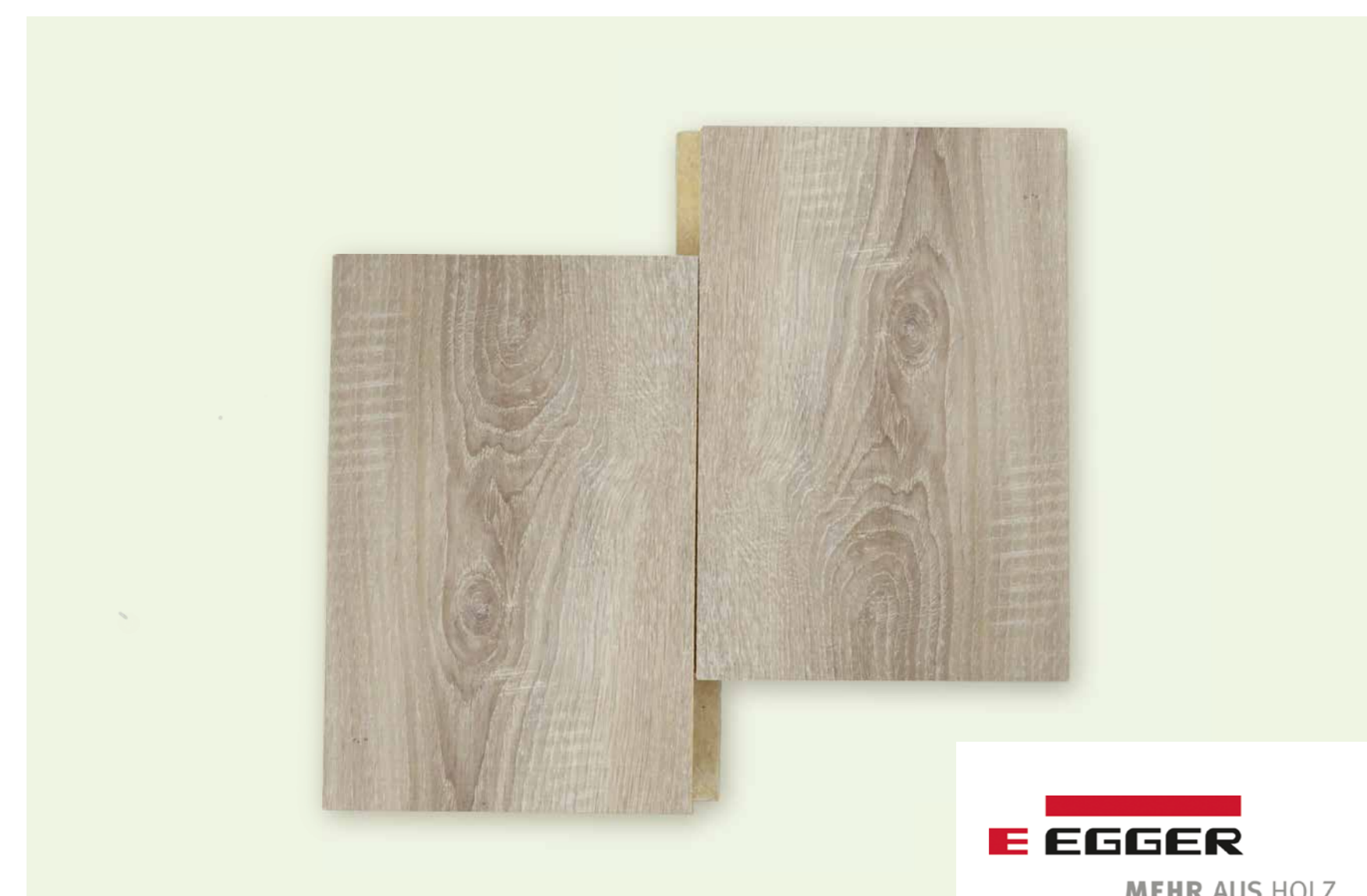
Produktionslinie MDF- und OSB-Platten