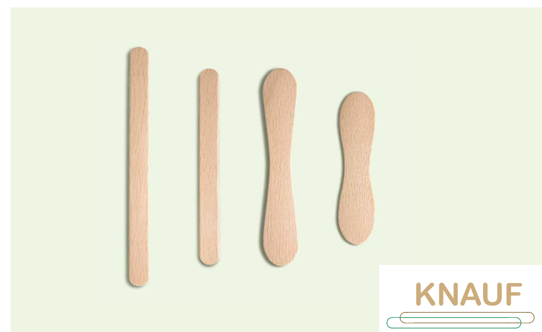
Produktionslinie für Eisstiele